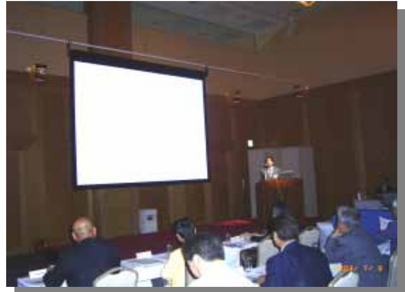
プレゼンテーション風景