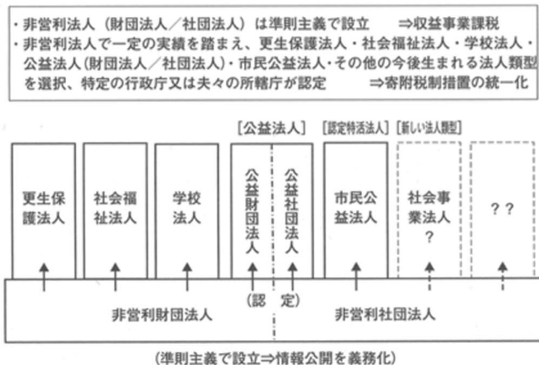
図 E 非営利法人制度の統一的将来像のひとつの考え方（山岡義典）

この提案について、私自身は一階部分の統一的非営利法人法制については全面的に賛成である。しかし、二階部分に関しては、寄付税制の適用を受けるための公益「認定」と、特定の公益的事業（医療、福祉、教育など）を実施するうえで必要な要件を満たしているという指定事業者「認定」とが混同されている点で異議がある。